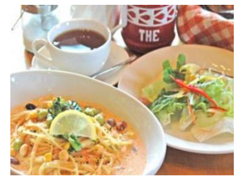
料理はイメージです