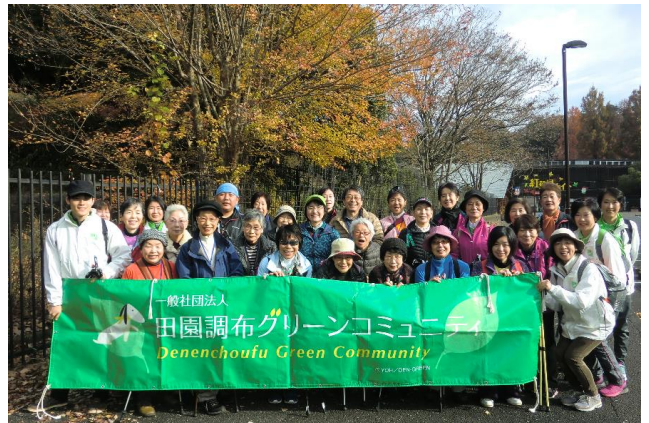
国営武蔵丘陵森林公園にて